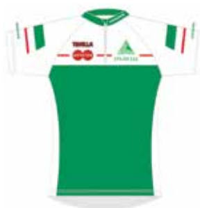
lyhythihainen paita 49€ (- seuratuki 20€)