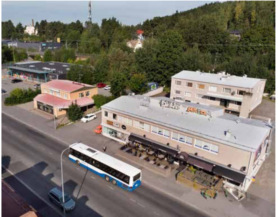
Kiinteistöosakeyhtiö Pispalanvaltatie 120:n rakennukset ovat päässeet pahasti rapistumaan.