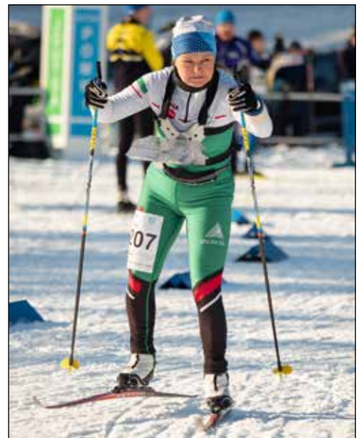
Saija SM-sprinttaviestissä Joutsassa.