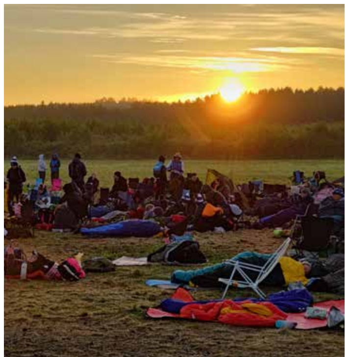
Aamun sarastaessa aurinko alkaa lämmittämään.