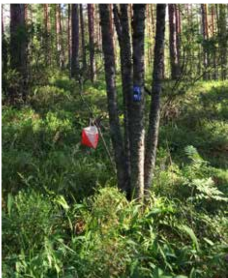
Rastit olivat hyvin näkyvillä.