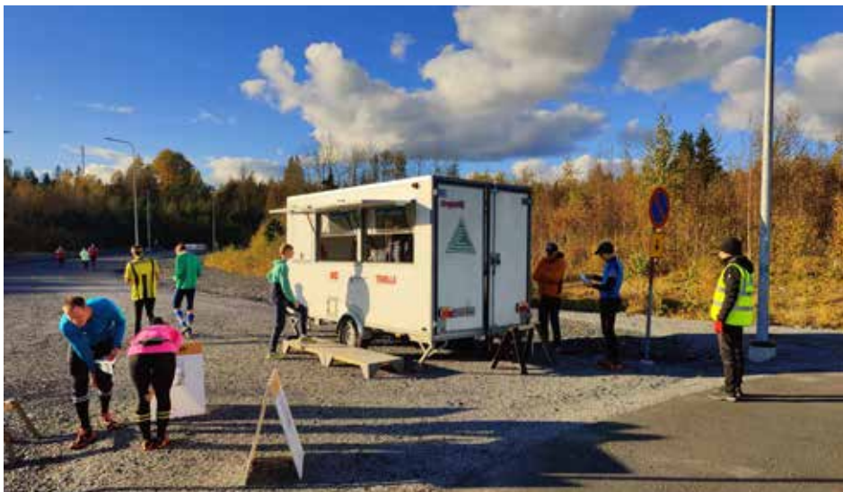
Siltatien koulun alue toimi uutena tapahtumapaikkana Viisajärven iltarasteilla syyskuun lopussa.