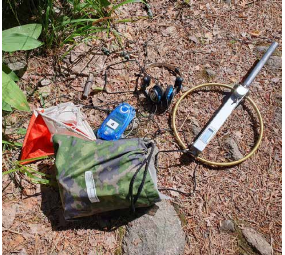
Tässä ovat radiosuunnistajan työkalut. Leimauksessa käytettiin oli SPORTident-laitteita.