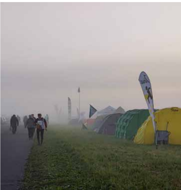
Usva nousee Jukolan kisa-alueella yön tullen.