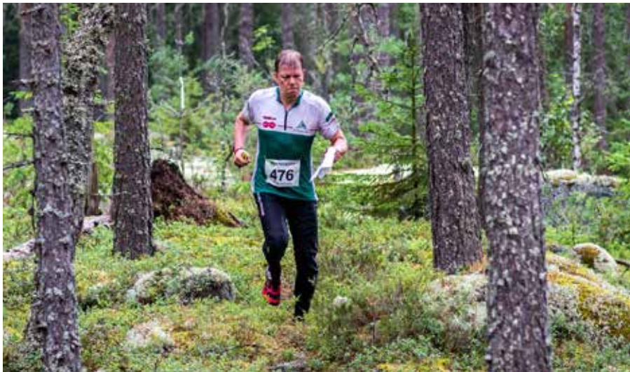
Väsyneenä ja märkänä AM-pitkällä Kangasalan Kuohenmaalla. (kuva VaHan nettisivuilta)