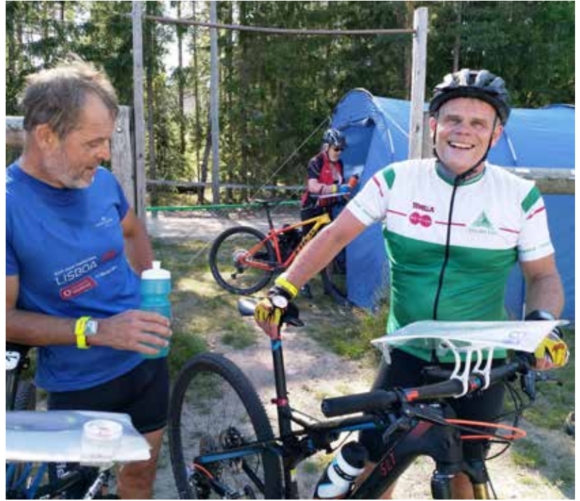
Tunnelmia Rajamäen SM-keskimatkalta maaliintulon jälkeen.