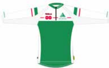
pitkähihainen paita 48€ (- seuratuki 20€)