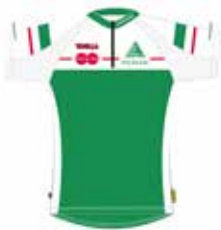
lyhythihainen paita 45€ (- seuratuki 20€)

Kevytuntuvaakin L-kokoinen mallikappale vuosikokouksessa 9.12.2020 !