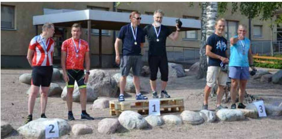
Hyvinkään SM-pariviestin palkintojenjako, Epilän miehet pronssilla.