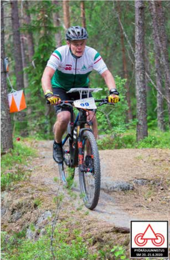
Pertsapolkemassa SM-pitkällä Tampereen Kaupissa.