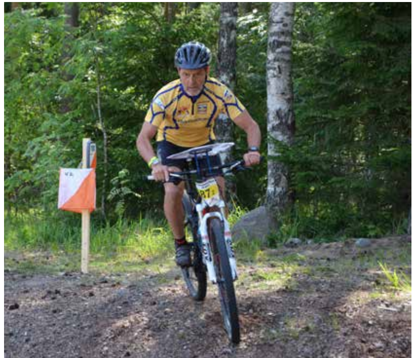
Tapsa vauhdissa Hyvinkään SM-pariviestissä.