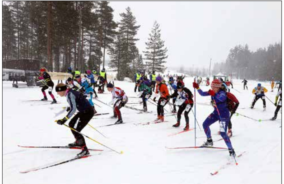
D80-sarjan sprinttiviestin lähtö, takana vasemmalla kiihdyttää Marja.