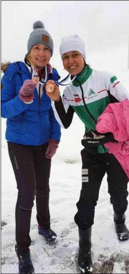
Marja ja Sirra esittelevät SM-pronssimitaleita.