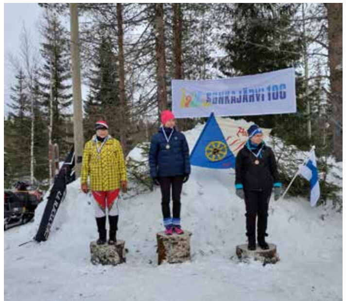
Sirralle SM-kultaa Sonkajärven pitkällä matkalla.