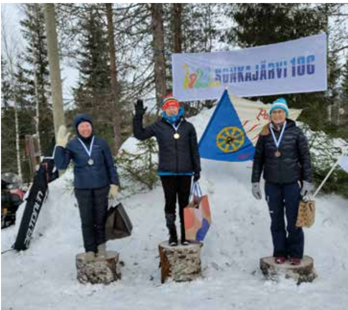
Johannalla SM-kultaa Sonkajärven pitkällä matkalla.