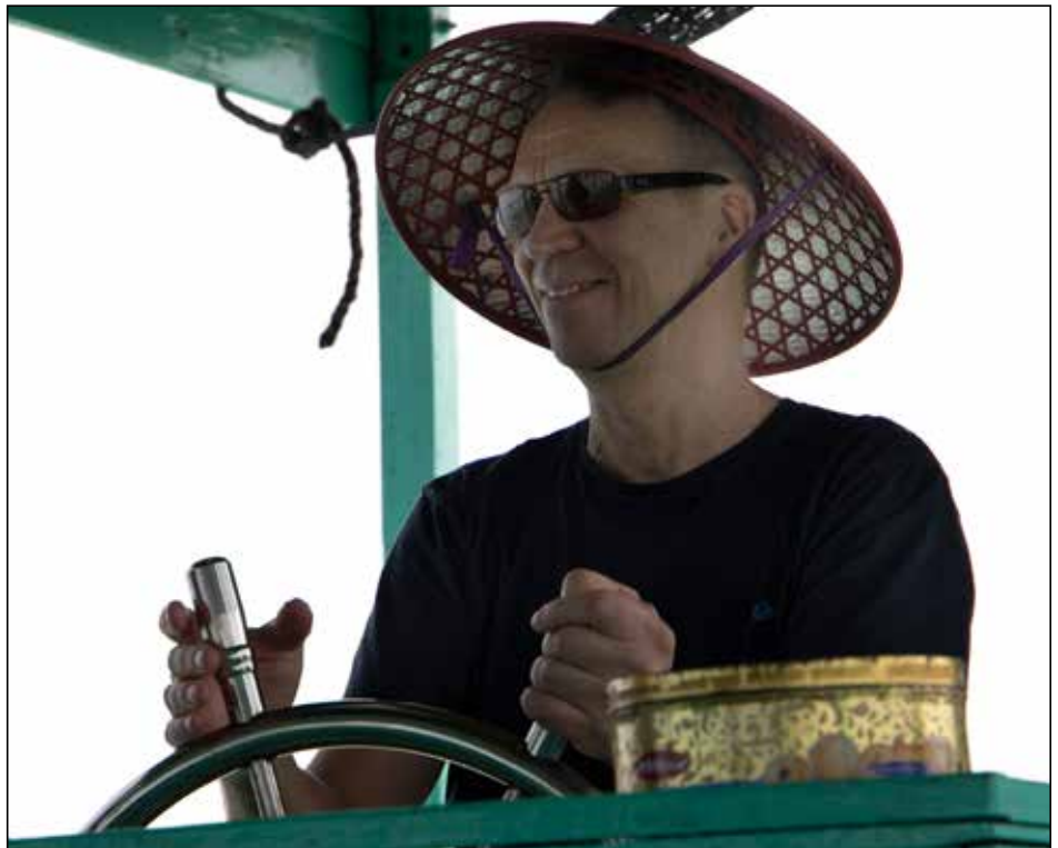
Uudella puheenjohtajalla on rahtunen aiempaa kokemusta kipparoinnista. Tässä hän ohjaa vietnamilaista jokilaivaa.