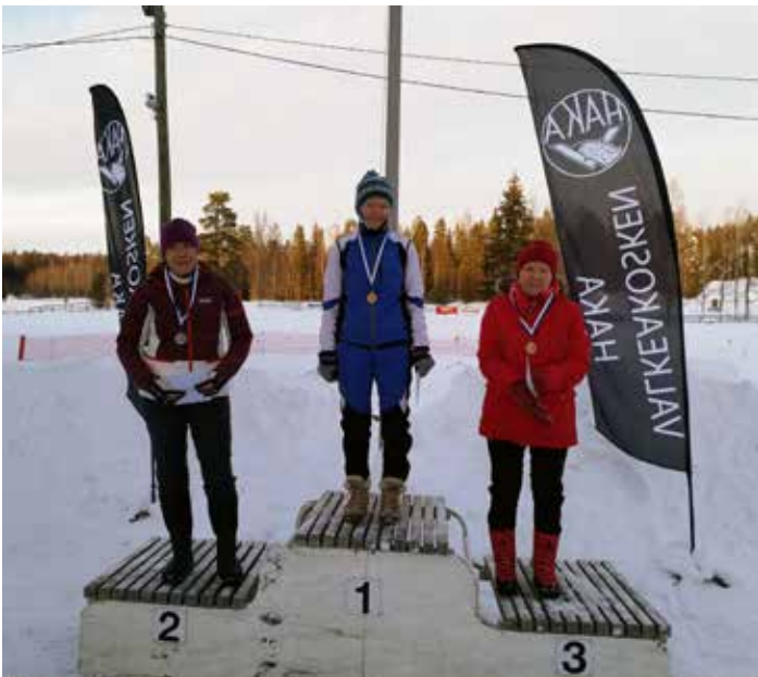
Annelle SM-kultaa Valkeakosken sprintissä.