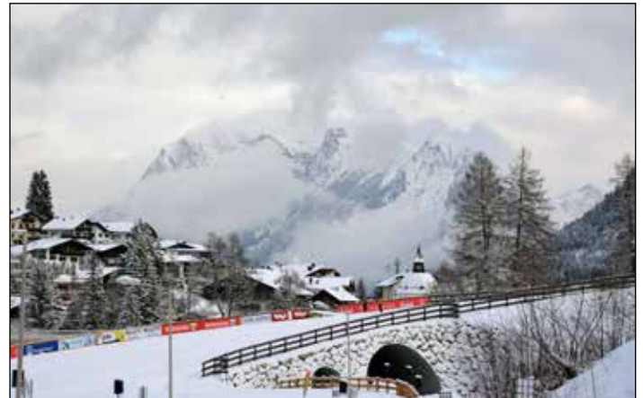
MM-kisojen vuoristoista maisemaa Seefeldissä.