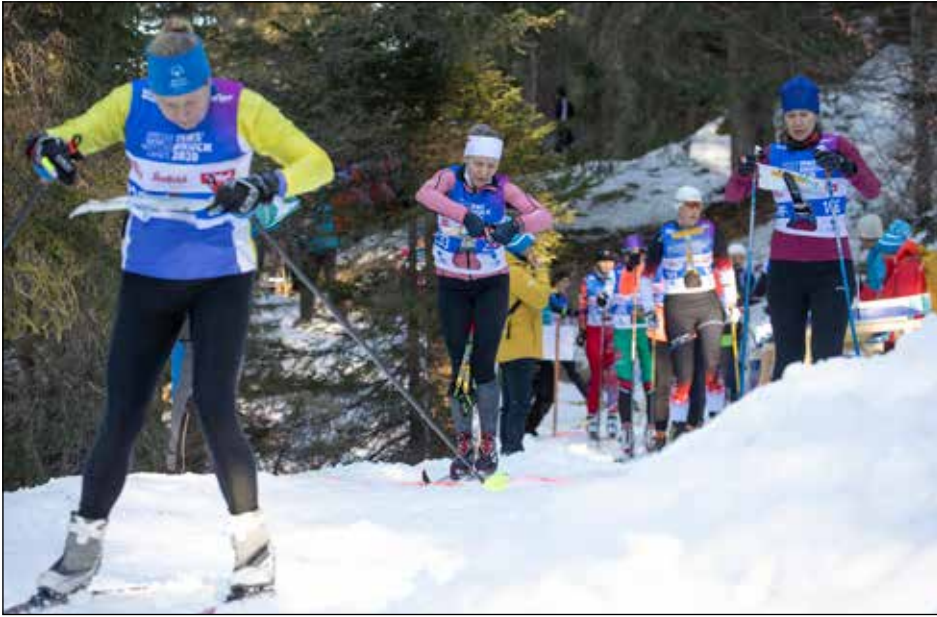
Tunnelmaa sprintin lähdöstä, taustalla myös Epilän Esan värejä.