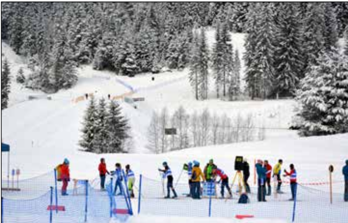
MM-hiihtosuunnistuksen keskimatkan "lähtötohinää".