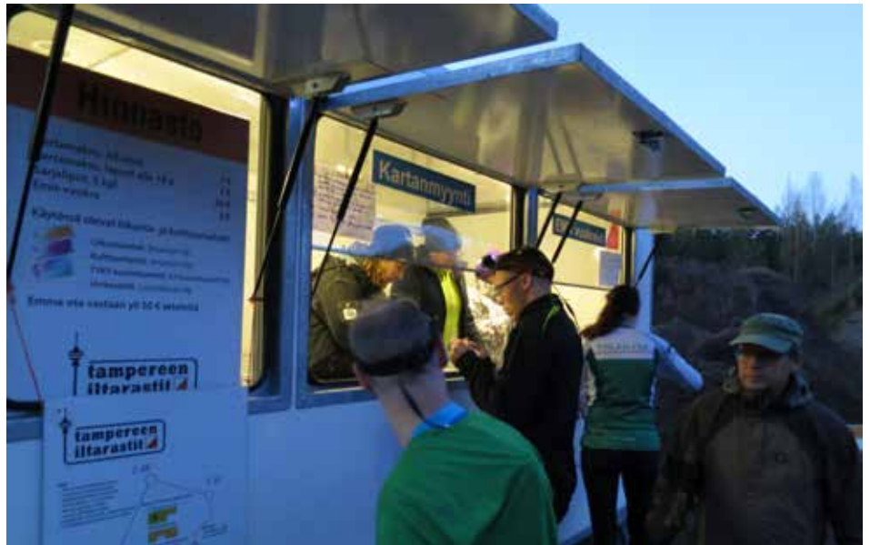
Seuran uusi rastivaunu kovassa käytössä, karttojen myyntiä Viisajärvellä 3.10. illan hämärtyessä.