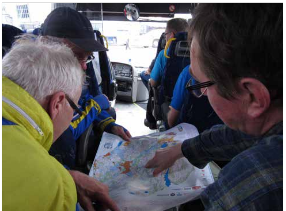
Paluumatkalla bussissa käytiin läpi reitinvalintoja Nouskilaisten ja Kyrös-Rastilaisten kanssa.