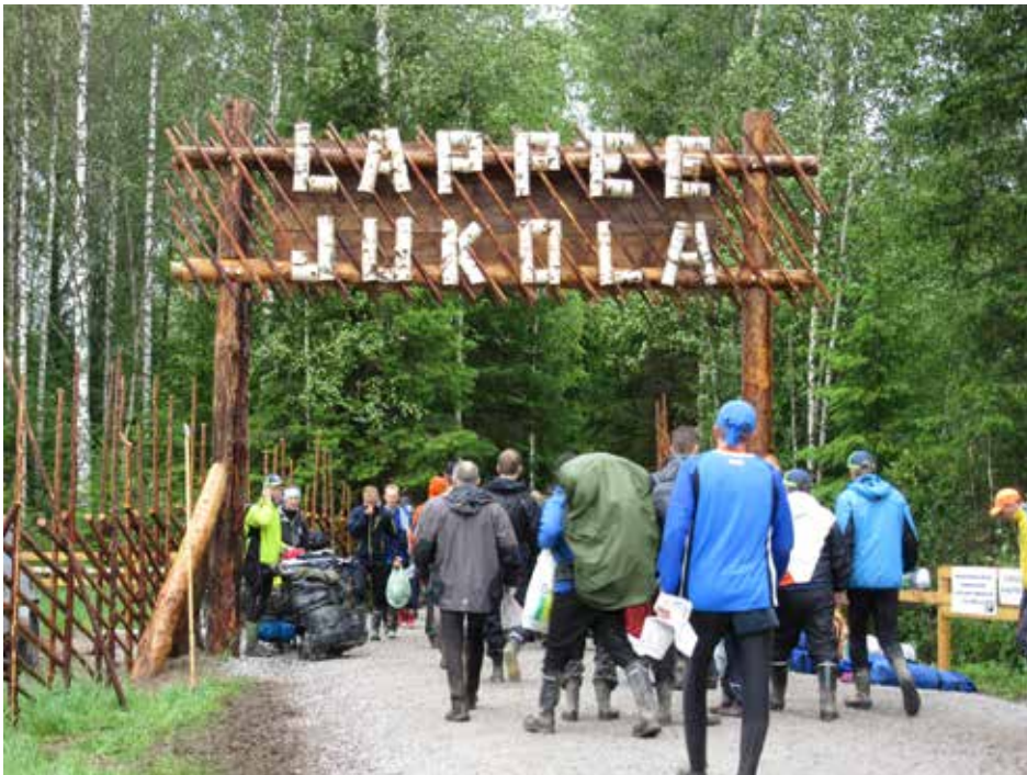
Sunnuntaina kisakeskuksesta poistuttaessa säätila alkoi jo hieman parantua.

Lappeenrannan Jukolassa sää oli katastrofaalinen, jatkuva sade ja tuuli piiskasivat kilpailualueetta, puita kaatui ja teltat meinasivat lähteä lentoon