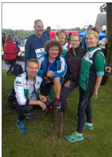
Epilän Esalaisia yhteiskuvassa WMOC-kisoissa.

Myös mallikartalla pääsi harjoittelemaan Tallinnan vanhaan kaupunkiin.