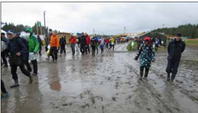
Kumisaappaat olivat tarpeen mutavellisissä tarpoissa.